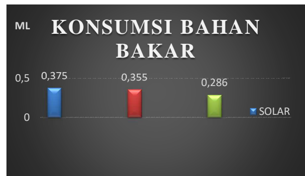
Gambar 4. Grafik Konsumsi Bahan Bakar

Pertamina dex merupakan bahan bakar diesel berkualitas tinggi dengan kadar sulfur yang rendah (dibawah 300 ppm), yang berfungsi untuk menghindari penyumbatan injektor, kandungan partikular sangat sedikit dan bersih dan menghasilkan emisi gas buang yang lebih ramah lingkungan, menghasilkan tenaga yang besar dan irit bahan bakar [4].