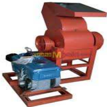
Gambar 1. Mesin Pencacah Plastik (Syamsiro, 2016)

Mesin pencacah plastik adalah alat yang dibuat untuk menghasilkan cacahan dari barang barang plastik menjadi bagian bagian kecil dengan ukuran tertentu agar dapat di gunakan untuk proses selanjutnya, mesin pencacah plastik saat ini banyak beragam bentuk dari bentuk casing , ukuran kapasitas sampai bentuk pisau potongnya, namun dari berbagai bentuk tersebut fungsi nya sama, banyak Prinsip kerja dari mesin pencacah plastik ini dengan menggerakkan pisau putar menggunakan motor diesel yang menggunakan sistem crusher dan silinder pemotong tipe reel. Daya dari mesin ini ditransmisikan menggunakan puli dan sabuk. Material sampah plastik yang sudah dibersihkan dimasukkan ke dalam mesin melalui corong masukan hingga mengenai pisau pencacah. Cacahan plastik kemudian keluar melalui saringan bawah dan corong keluaran [6].