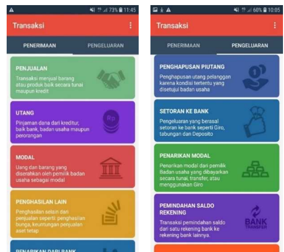
Gambar 4 Menu Transaksi

menu penjualan, utang, modal, penghasilan lain, penarikan dari bank dan pendapatan diterima dimuka. Sedangkan Transaksi pengeluaran terdapat menu pembelian persediaan, kewajiban, pembelian aset, beban, penghapusan piutang, setoran ke bank, penarikan modal, pemindahan saldo, stock opname persediaan, dan beban dibayar dimuka.