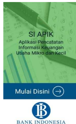
Gambar 1 Menu Utama