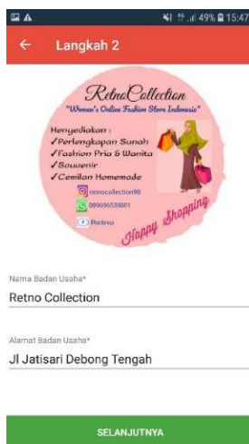
Gambar 3 Langkah Kedua