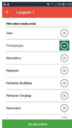
Gambar 2 Langkah Utama