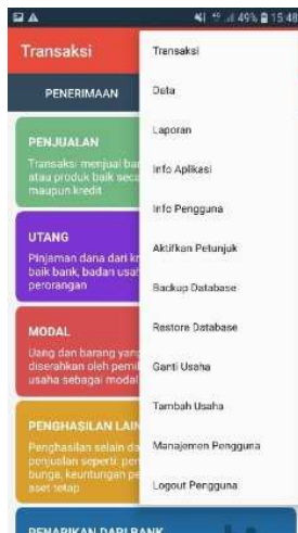
Gambar 5 Tampilan Daftar Seluruh Menu

Jika sudah memahami menu-menu dalam aplikasi SI APIK ini. Aplikasi bisa langsung digunakan untuk memulai melakukan memasukkan data transaksi baik itu penerimaan maupun pengeluaran usaha tersebut.