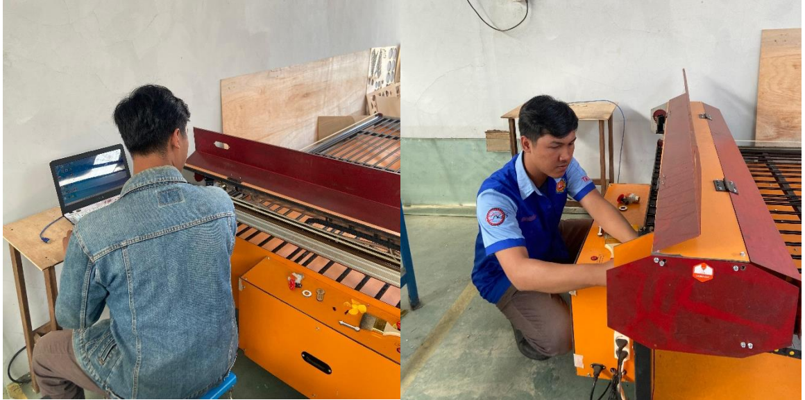
Lampiran 1. Dokumentasi