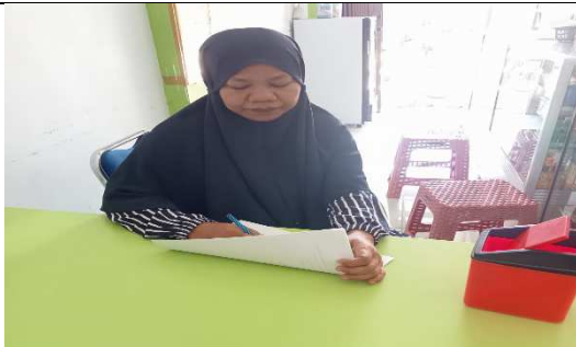
Responden Konsumen Apotek Widya Farma