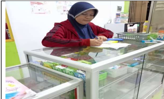
Responden Konsumen Apotek Widya Farma