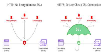
Gambar 4 Server keamanan pada website