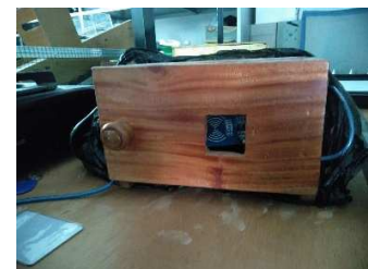
Gambar 2 RFID untuk membuka alat