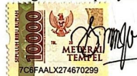
TATI SARIYATI NIM 21030108