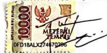
Fitri Wahyuni NIM 21030106

Tegal, 5 Juli 2024 Yang membuat pernyataan,