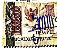
RIFALO PRAMUDITO NIM 21030099