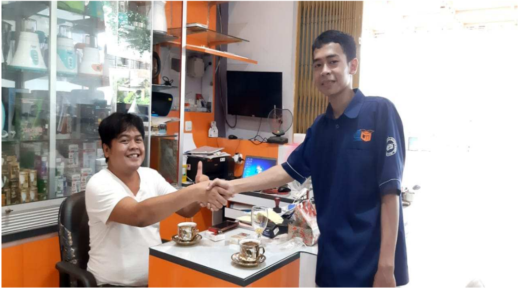
Lampiran 1 Foto Wawancara